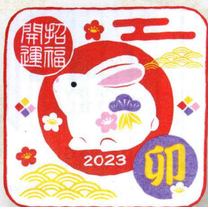
17-34 干支タオルハンカチ