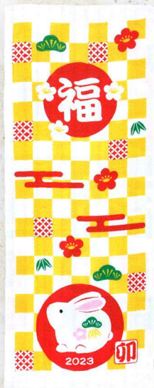
17-32 干支フェイスタオル