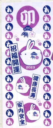
17-33 開運干支手ぬぐい