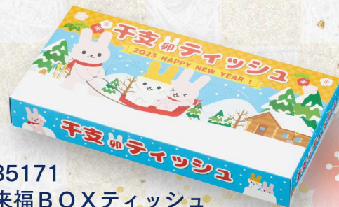
35171 来福BOXティッシュ 40W 卯