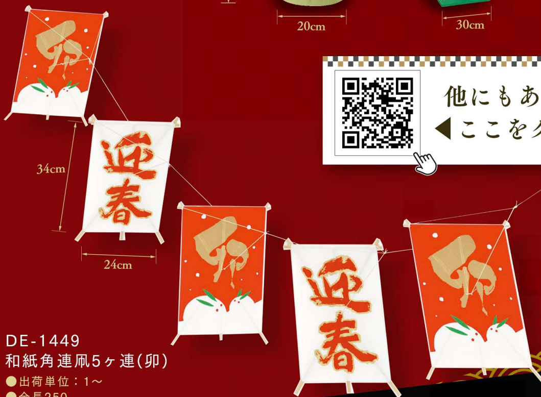
DE-1449 和紙角連凧5ヶ連(卯)