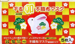
17-31 干支<卯>不織布マスク (個包装マスク5枚入)