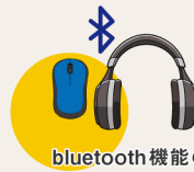
Bluetooth機能の付いた製品