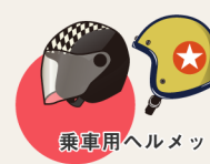
乗車用ヘルメット