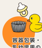
容器包装・乳幼児用のおもちゃ